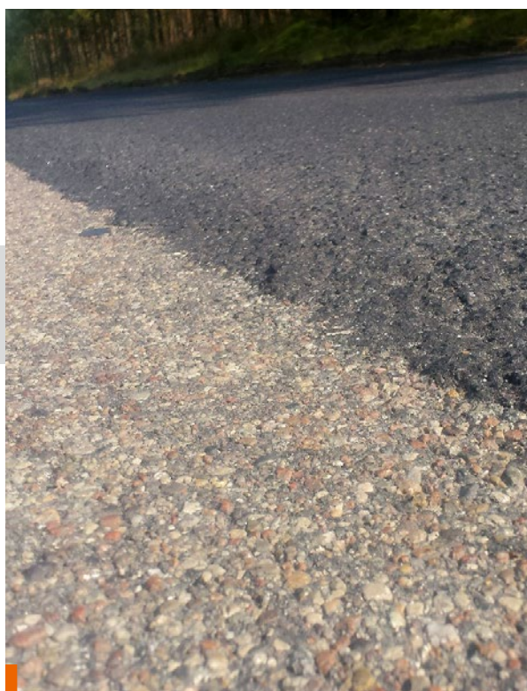
Zabezpieczona nawierzchnia vs nowa warstwa CWZ