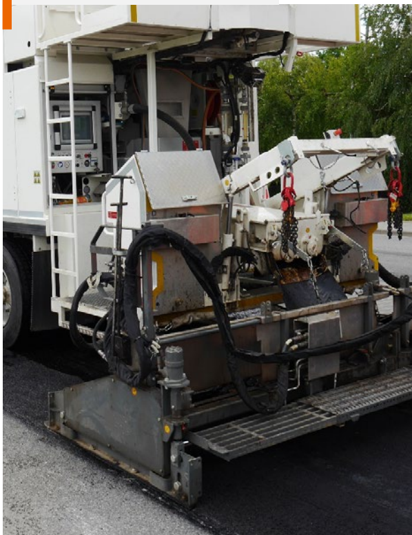
Kombajn drogowy do CWZ (widok części roboczej)