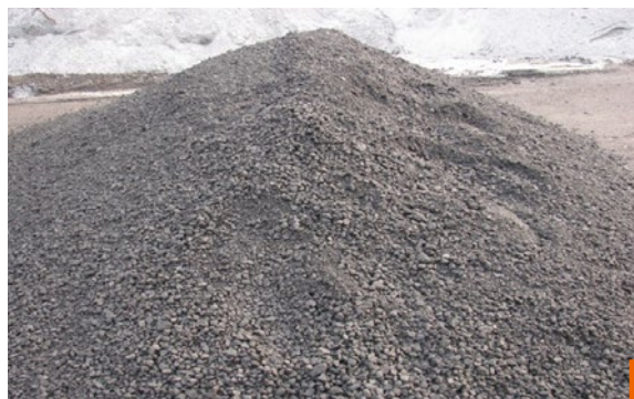
Gotowa mieszanka mineralno-emulsyjna GE