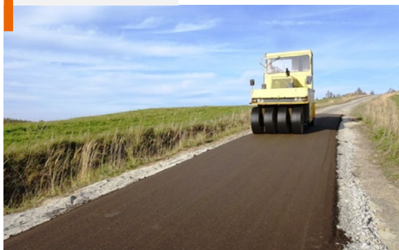
Zagęszczanie mieszanki GE