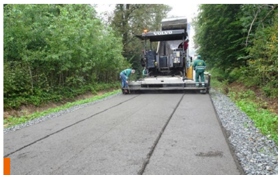
Układanie mieszanki mineralno-emulsyjnej GE