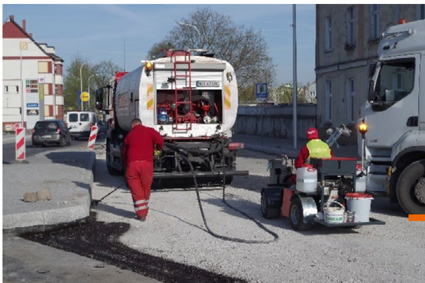
Skropienie dolnej części krawężnika z użyciem lancy

Skropienie warstw z mieszanek mineralnych niezwiązanych lub związanych spoiwami hydraulicznymi – aplikacja emulsji asfaltowej (wyłącznie o wydłużonym czasie rozpadu) wykonana na placu budowy. Jej celem jest powierzchniowa impregnacja lepiszczem asfaltowym ziaren kruszyw w górnej części warstwy mineralnej oraz jej dodatkowa stabilizacja, a także przygotowanie powierzchni warstwy mineralnej pod ułożenie pierwszej warstwy z mieszanki mineralno-asfaltowej (łatwiejsze zagęszczanie pierwszej warstwy asfaltowej – eliminacja zjawiska poślizgu).