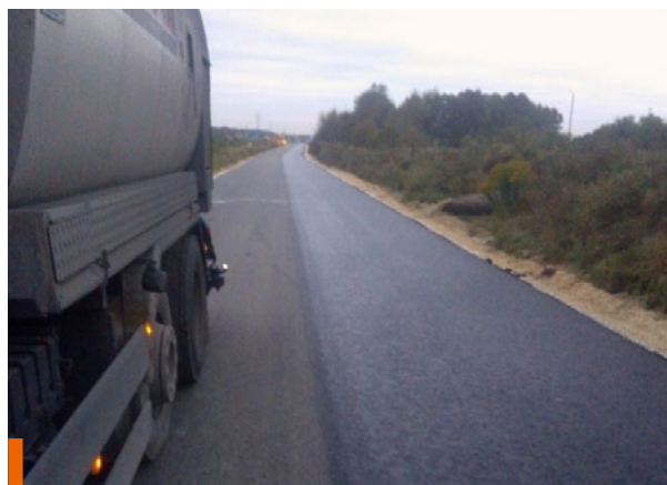
Skropienie warstwy asfaltowej przed ułożeniem kolejnej warstwy

Złączenia międzywarstwowe emulsją asfaltową powinny być wykonywane przy użyciu samojezdnej skraparki wyposażonej w skalibrowany, komputerowo sterowany system dozowania emulsji. Taki sprzęt gwarantuje jednorodność wykonania oraz właściwą ilość dozowanej emulsji na jednostkę powierzchni. W trudno dostępnych miejscach skropienie emulsją może być wykonane stosując specjalistyczną lancę.