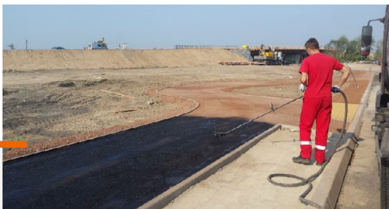
Skropienie trudno dostępnej powierzchni z użyciem lancy