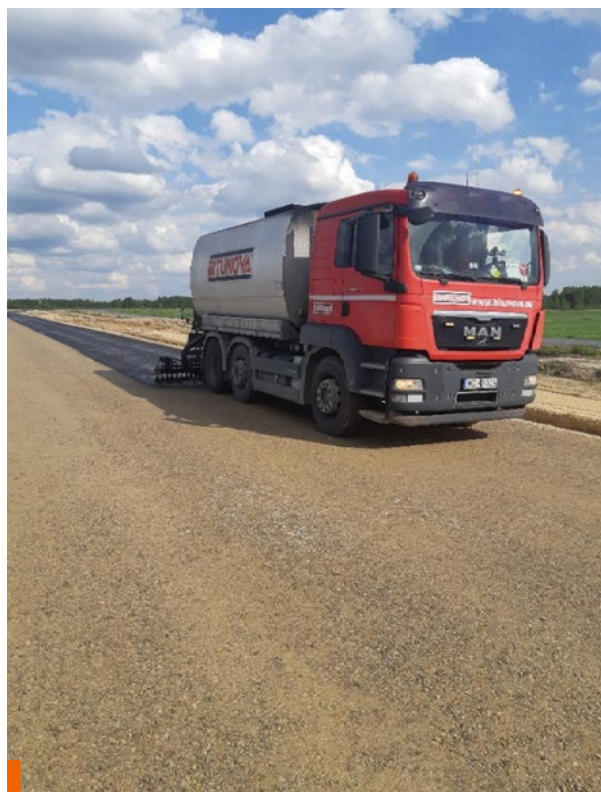
Podłoże przygotowane do skropienia – podbudowa z kruszywa i warstwa asfaltowa

Układanie kolejnej warstwy asfaltowej można rozpocząć po stwierdzeniu całkowitego rozpadu emulsji (powierzchnia skropionej warstwy powinna mieć jednorodny czarny kolor, bez płynnych zastoisk). Stosowanie mleczonego wapiennego w celu zapobiegania przyklejaniu się kół pojazdów jest uzasadnione wyłącznie po całkowitym rozpadzie emulsji.